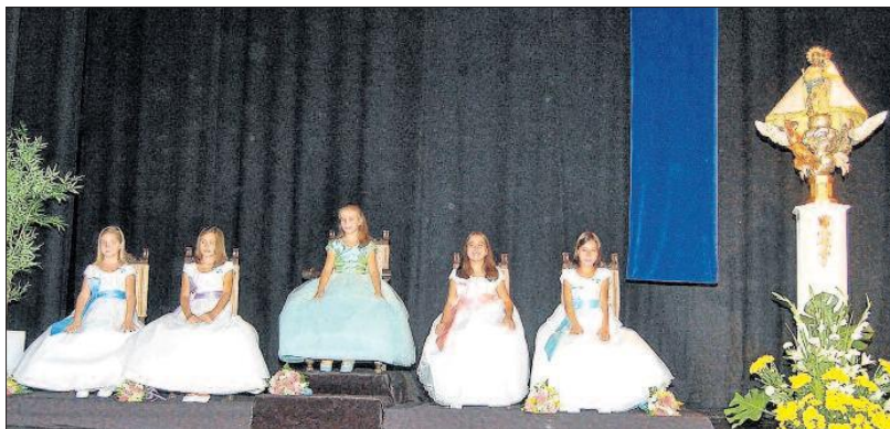
Las cinco Damas de la Virgen, el sábado, sobre el escenario del Gran Teatro. ALFONSO ROVIRA

El acto daba comienzo poco después de las diez de la noche del