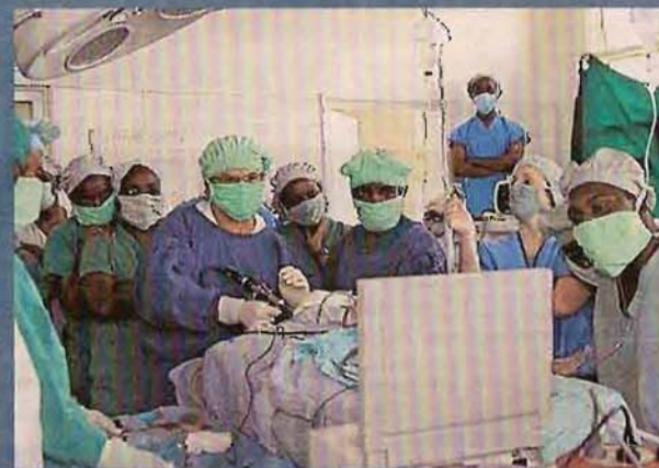
Facultativos y sanitarios de la Fundación NED en una operación.

» Información y donativos en http://www.nedfundacion.org