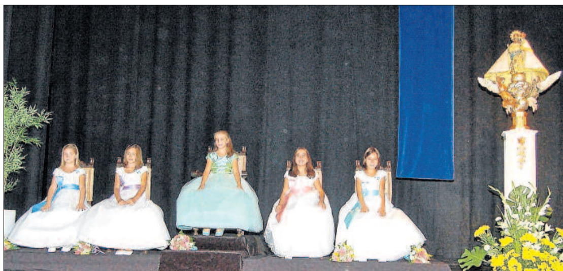
Las cinco Damas de la Virgen, el sábado, sobre el escenario del Gran Teatro. ALFONSO ROVIRA

El acto daba comienzo poco después de las diez de la noche del